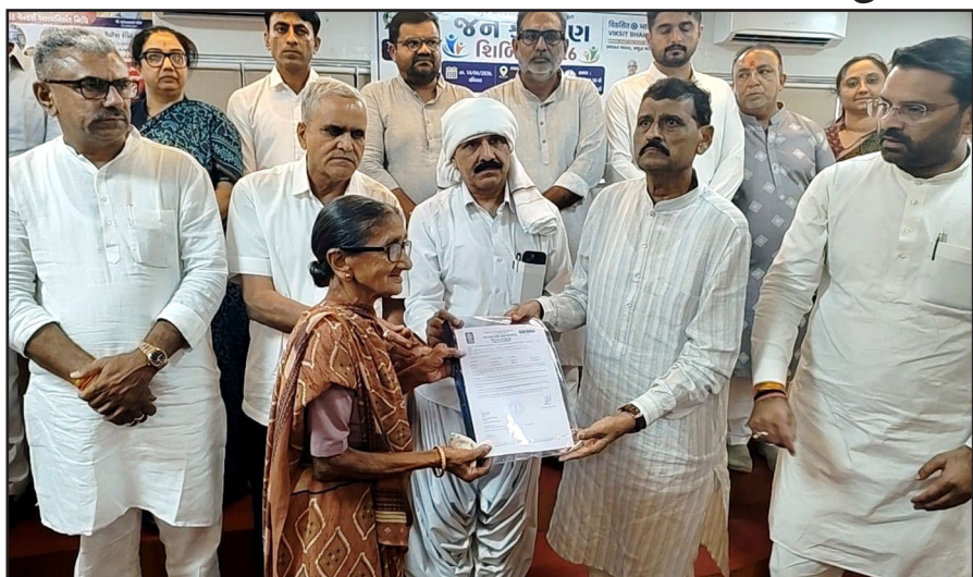
લુજમાં કેન્દ્ર સરકારના ૧૨ વર્ષના સુશાસનની ઉપલબ્ધિઓ અંતર્ગત જન કલ્યાણ શિબિર યોજાયેલ : લાભાર્થીઓને વિવિધ યોજનાઓના ચેક વિતરણ કરાયા