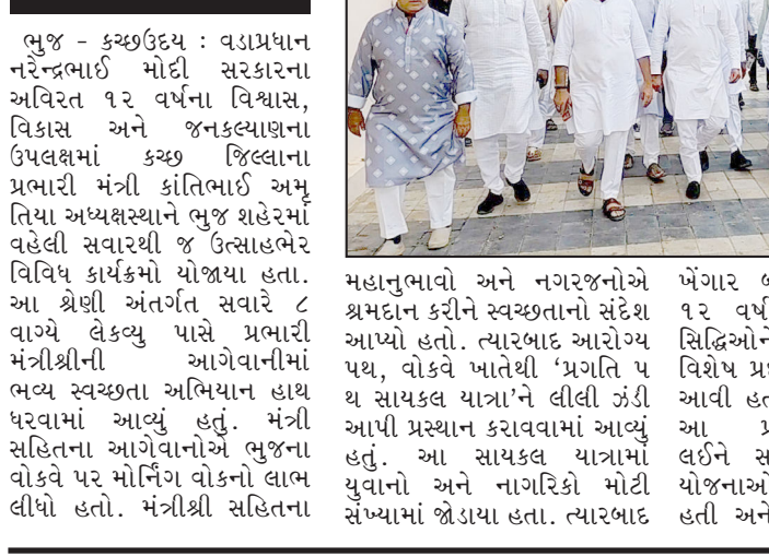
લુજમાં પ્રભારી મંત્રીની ઉપસ્થિતિમાં સ્વચ્છતા અભિયાન, સાયકલ યાત્રા અને પ્રદર્શન સાથે ત્રિવેણી કાર્યક્રમો યોજાયા

જિલ્લા ભારતીય જનતા પાર્ટીના પ્રમુખ દેવજીભાઈ વરવંદે જણાવ્યું હતું કે, વડાપ્રધાન નરેન્દ્ર મોદીના નેતૃત્વમાં કેન્દ્ર સરકારે છેલ્લા ૧૨ વર્ષથી ગરીબ અને મધ્યમ વર્ગના લોકોના જીવન ધોરણમાં સુધાર થાય તે માટે સતત ચિંતા સેવી છે. ગરીબોના કલ્યાણ માટે કેન્દ્ર સરકાર દ્વારા અમલમાં આવેલી અનેક જન કલ્યાણકારી યોજનાઓના કારણે ગરીબોના જીવનધોરણ સુધાર છે સાથે જ દેશના કરોડો લોકો ગરીબીથી બહાર આવ્યા છે. વડાપ્રધાન નરેન્દ્ર મોદીએ વર્ષ ૨૦૨૭ સુધી દેશને વિકસિત રાષ્ટ્ર બનાવવાનું આયત્ન કર્યું છે. ગરીબોના કલ્યાણ અને છેવાડાના આતિમ વ્યક્તિ સુધી વિકાસના લાભ પહોંચાળી વિકસિત ભારતની પરિકल्पનાને સાકાર થયે તેવું તેમણે વધુમાં ઉમેર્યું હતું.