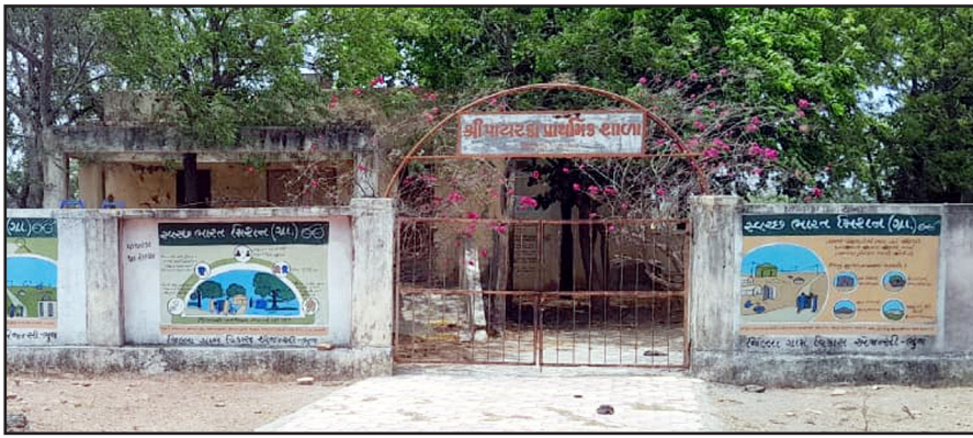
શાળાના ગેટને લગાવેલા લોક કચારે ખોલવામાં આવશે..? તેવો વિદ્યાર્થીઓ અને ગામજનોનો વેદક સવાલ

ભુજ - કચ્છઉદય : તાલુકાની પાયરકા પ્રા. શાળાને હજુ સુધી શરૂ કરવામાં આવી નથી. વેકેશન પૂર્ણ થયા બાદ જ્યારે કચ્છની અનેક શાળાઓમાં પ્રવેશ ઉત્સવ મનાવી રહ્યા છે. ત્યારે પાયરકા નાના એવા ગામની શાળા બંધ છે. આશરે ત્રણ વર્ષ પહેલા આ ગામની શાળા જે રેગ્યુલર હતી. બાદમાં શાળામાં વિદ્યાર્થીઓની સંખ્યામાં ઘટાળો થતા આ શાળાને બાજુના મમણા ગામની પ્રા. શાળામાં મજૂ કરી દેવામાં આવી શક્યાં નહોતાં. આ પાયરકા આ બંને ગામનું ૬ કિમીનું અંતર છે. જ્યારે આરટીઈના નિયમ મુજબ ૩ કિમી કે અથવા એથી પણ અંતર આંશુ હોય અને એક શાળામાં વિદ્યાર્થીઓની સંખ્યા ઓછી હોય તેવા સંજોગોમાં એક શાળાને બીજી શાળામાં મજૂ કરી શકાય છે. પરંતુ પાયરકા ગામની શાળાની સ્થિતિ જોવા જઈએ તો આજુ બાજુના ના જે ગામો