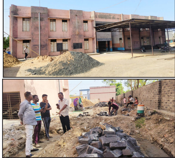
ગાંધીધામ - કચ્છ ઉદય : શહેરમાં મહેશ્વરી નગર વિસ્તારમાં પંચાયત શાળામાં બાઈન્ડરી અને બાયરમનું કામ ચાલુ રહ્યો છે જે બ્રહ્મચાર્ય કરી કામની ગુણવત્તા અને મજબૂતી જોવા મળી રહી નથી. કોન્સ્ટ્રક્શન વારંવાર કામની વિગતો માંગતા હાનાકાની કરી કામમાં ગેરજોખેદારી પુલક