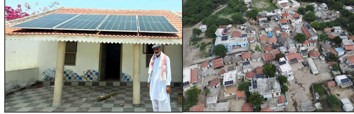
ભુજ - કચ્છઉદય : આગામી વર્ષમાં ભારતમાં ઊર્જામાંગની વૃદ્ધિને પહોંચી વળવા તેમજ કોલસા અને અન્ય સ્ત્રોતો પર નિર્ભરતા ઘટાડીને પુનઃપ્રાપ્ય ઊર્જા ક્ષમતા હાંસલ કરવા કેન્દ્ર અને રાજ્ય સરકાર કટિબદ્ધ છે.

બિન-અસ્થિભૂત ઈંધણ સ્ત્રોતોમાંથી મહત્તમ વીજળી ઉત્પાદનના ધ્યેયને પહોંચી વળવા તેમજ સૌરઊર્જા માટેની આપણી ક્ષમતાને વિસ્તારવા વડાપ્રધાન નરેન્દ્રભાઈ મોદીએ પ્રધાનમંત્રી સુર્યોદય યોજના કાર્યક્રમ અમલી કર્યો છે, જેમાં કચ્છમાં પ્રવાસન સ્થળ ઘોરડોએ ગત વર્ષે ૧૦૦ ટકા સોલારાઈઝેશનની સિદ્ધિ પ્રાપ્ત કર્યા બાદ વર્તમાન સમયમાં તેના મીઠાકળ યાખી રહ્યું છે. સૌરઊર્જાથી ગ્રામીણોના જીવનધોરણમાં મોટો ફેરફાર આવ્યો છે, ભારત-પાકિસ્તાન સરહદ નજીક વસેલા ભારતના આ ગામે કાર્બન ફૂટપ્રિન્ટમાં ઘટાડો કરવામાં પોતાનું યોગદાન આપ્યું છે. ૮૧થી