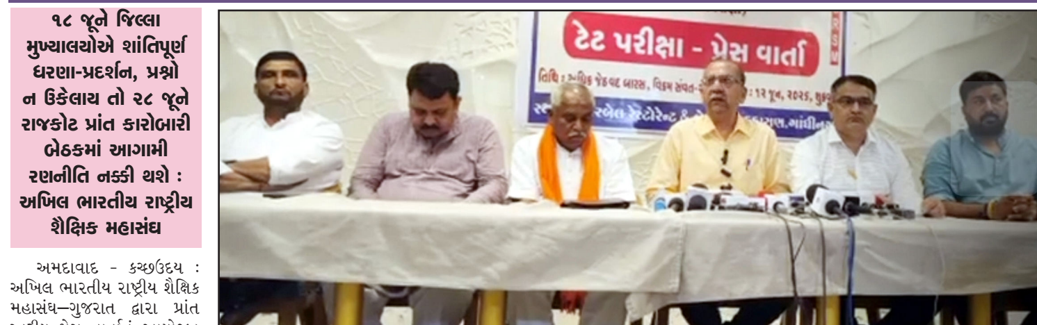
૧૮ જૂને જિલ્લા મુખ્યાલયોએ શાંતિપૂર્ણ ઘરણા-પ્રદર્શન, પ્રશ્નોન ઉકેલાય તો ૨૮ જૂને રાજકોટ પ્રાંત કારોબારી બેઠકમાં આગામી રણનીતિ નક્કી થશે : અખિલ ભારતીય રાષ્ટ્રીય શૈક્ષિક મહાસંઘ

નિયુક્ત થયેલા શિક્ષકોના હિતો અંગે સંગઠન દ્વારા ગંભીર ચિંતા વ્યક્ત કરવામાં આવી છે. કે લાખો શિક્ષકોના સેવા હિતો, વરિષ્ઠતા, બઢતી અને અન્ય પ્રામ અધિકારોને અસર થવાની સંભાવનાને ધ્યાનમાં રાખીને કેન્દ્ર સરકાર યોગ્ય કાયદાકીય, નીતિગત તથા વહીવટી ઉકેલ લાવે તેવી માંગ કરવામાં આવી છે.