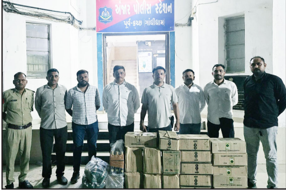
કિંમતનો દારૂનો જથ્થો જમ કર્યો છે. પ્રાથમિક તપાસમાં

અંજાર : અંજાર પોલીસ પ્રોહિબિશન વિરોધી ઝુંબેશ અંતર્ગત મેઘપર કુંભારડી વિસ્તારમાં દરોડી પાટી વિદેશી દારૂનો મોટો જથ્થો ઝડપી પાડ્યો છે. ચોક્કસ માત્રામાં આધાર રેવેન્યુનાર ખાતે આવેલા એક મકાનમાં ૨૬ દરમિયાન વિવિધ બ્રાન્ડની વિદેશી દારૂની બોટલો મળી આવી હતી. પોલીસે આ કાર્યવાહી દરમિયાન અંદાજે ૩.૧૪૭ લાખની