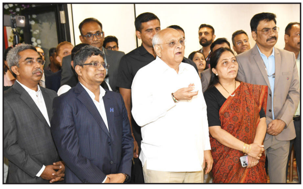
ગિફ્ટ સિટીમાં હેક્સાવેર ટેકનોલોજીનું નવા ડિલિવરી સેન્ટરનું મુખ્યમંત્રીના હસ્તે ઉદ્ઘાટન

ગાંધીધામ : મુખ્યમંત્રી ભુપેન્દ્ર પટેલે આજે ગાંધીધામ સ્થિત ગિફ્ટ સિટીમાં હેક્સાવેર ટેકનોલોજીના નવા ડિલિવરી સેન્ટરનું ઉદ્ઘાટન કર્યું હતું. ગિફ્ટ સિટીના પ્રધાન- II બિલ્ડિંગના ૭મા અને ૮મા માળે શરૂ થયેલું આ અત્યાધુનિક સેન્ટર ગુજરાતની ટેકનોલોજી ઈન્ડીસ્ટ્રી માટે એક મહત્વપૂર્ણ સીમાચિહ્ન બનશે. આ સેન્ટરના પ્રારંભથી આર્ટિફિશિયલ ઈન્ટેલિજન્સ, ક્લાઉડ કમ્પ્યુટિંગ, ડેટા એનાલિટિક્સ, ઓટોમેશન અને ડિજિટલ ટ્રાન્સફોર્મેશન જેવા અદ્યતન ક્ષેત્રોમાં નવી તકોનું સર્જન થશે તેમજ ઉચ્ચ કોશલ્ય ધરાવતા યુવાનો માટે રોજગારીના નવા દ્વાર