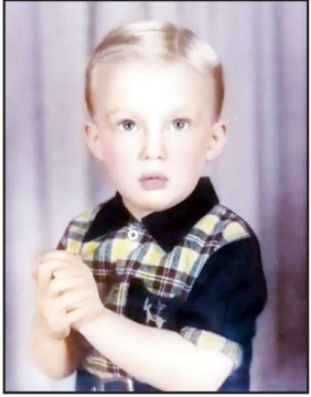
ડોનાલ્ડ ટ્રમ્પનો ચાર વર્ષની ઉંમરનો ફોટો