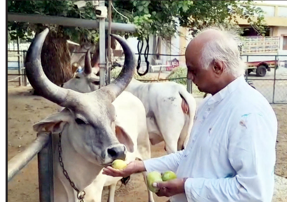
ગાયોને ૫૦૦ કિલો કેરી ખવડાવવામાં આવી

અંજાર - કચ્છ ઉદય : તાલુકાના નાગલપર ગામ ખાતે આવેલી સચિદાનંદ સંપ્રદાય સંચાલિત વ્રજ ગૌશાળામાં ગૌસેવાનો અનોખો કાર્યક્રમ યોજાયો હતો. ગૌશાળામાં રહેલી ગાયોને આશરે ૫૦૦ કિલો કેરી ખવડાવી ગૌસેવા કરવામાં આવી હતી. આ પ્રસંગે ગોખતો અને સેવાભાવીઓએ ઉત્સાહભરે ભાગ લીધો હતો. ઉનાળાની ઋતુમાં ગાયોને પોષ્ટિક અને પોષણયુક્ત આહાર મળે તે હેતુથી