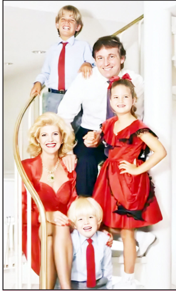
યુવાન ટ્રમ્પ પહેલી પત્ની અને બાળકો સાથે

ફાવતા પોતાની માની સલાહથી અમેરિકામાં પરપરાગત ખેતી કરવાની જગ્યાએ વાળંદ તરીકે કામ શરૂ કર્યું હતું. પરંતુ નસીબ જયારે ચારી આપે છે ત્યારે જિંદગી બદલી જાય છે. તેમના દાદા પાસે થોડા પૈસા ભેગા થતાં તેમણે ખાણ ખરીદી જેમાંથી સોનું નીકળ્યું એટલે રાતોરાત અમીર થઈ ગયા હતા. ડોનાલ્ડ ટ્રમ્પના પિતા ધનવાનના દીકરા હોવા છતાં પણ ખૂબ જ મહેનતુ હતા. તેઓ શાળામાં ભણતા અને બાકીના સમયમાં પ્લમ્બરિંગ સુધારી કામ અને ઈલેક્ટ્રીક કામ શીખતા કારણ કે તેમને મહેનત કરવાનો બહુ જ શોખ હતો. ટ્રમ્પના જન્મ પછી તેઓ પછી તેઓ અમેરિકાના મોટા ઉદ્યોગપતિ અને અતિ શ્રીમંત બની ગયા. ટ્રમ્પ બચપણથી જ બહુ જ માથાભારે હતા અને સાથેના વિદ્યાર્થીઓ ઉપર ભારે