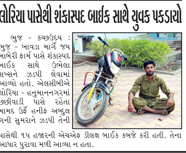
લોરિયા પાસેથી શંકાસ્પદ બાઈક સાથે યુવક પકડાયો

ભયાઈ - કચ્છઉદય : ભયાઈ તાલુકાના બાનીયારી ગામની સર્વે નંબર. ૧૭૫/૫૧/૧, ૧૭૫/૫૧/૨ તથા ૫૫૫/૫૧/૧૧ વાળી વિવાદિત ખેતીની જમીન સંબંધે કલેક્ટરનો નોંધ નં. ૭૭૧ સામે દાખલ થયેલ અપીલમાં દ્વારા દલીલો અને દસ્તાવેજ પુરાવાઓ રજૂ કરવામાં આવ્યા હતા. નાયબ કલેક્ટરે રેકર્ડ અને રજૂઆતોનું અવલોકન કર્યા બાદ જમીનના હક્ક અંગે વિવાદ અસ્તિત્વમાં હોવાનું પ્રાથમિક રીતે નોંધ્યું હતું અને કોજદારી ફરિયાદના અંતિમ નિર્ણય સુધી કોઈપણ પક્ષ દ્વારા જમીનની સ્થિતિમાં ફેરફાર ન થાય તે માટે સ્ટેટસ ક્વો જાળવવાનો હુકમ કર્યો છે.