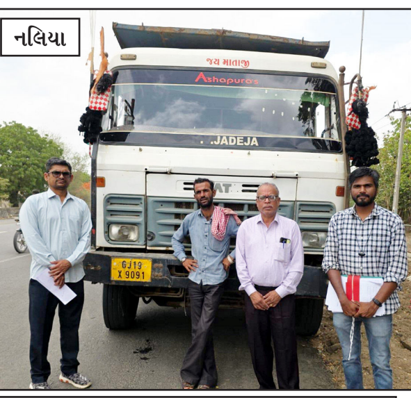
નલિયામાં પ્રાંત અધિકારી ઓવરલોડ બ્લેક ટ્રેપ ભરેલી અને નખત્રાણામાં પ્રાંતે રોયલ્ટી વગર રેતી લઈને જતા ડમ્પરને ક્યુ સીઝ : રવિવારે પણ બન્ને વિસ્તારમાં ચાર ગાડીઓ પકડાઈ હતી : ભુજ, ભયાઈ અને મુંદરાના પ્રાંત અધિકારી આવી કાર્યવાહી કરવારે દેખાડશે ?

ભુજ - કચ્છઉદય : પશ્ચિમ કચ્છ જિલ્લામાં ઓવરલોડ અને ખેતીજ ચોરીના મામલા વધી રહ્યા છે. કાર્યવાહી કરવા માટે પશ્ચિમ કચ્છ જિલ્લામાં ભુજ ખાણ ખેતીજ વિભાગ, ફ્લાઈંગ સ્કવોડ, આરટીઓ, પોલીસ હોવા છતાં કોઈ નક્કર કામગીરી થતી નથી. ત્યારે અંતે નખત્રાણા અને અબડાસા વિસ્તારના પ્રાંતને મેદાનમાં ઉતરવાની ફરજ પડી છે. નખત્રાણાના કોટડા જોડેદર અને અબડાસામાં હાજરપર પાસે રવિવારે પ્રાંતની સુચનાથી મામલતદારે કુલ્લ યાર ઓવરલોડ ખેતીજ ભરેલી ગાડીઓ પકડી હતી ત્યારે હવે સોમવારે નખત્રાણામાં પ્રાંતે ગેરકાયદે ખેતીજની અને નલિયામાં પ્રાંતે ઓવરલોડ ખેતીજની ગાડીઓ પકડી છે. બન્ને વિસ્તારમાં પ્રાંત અધિકારી જતા હતા ત્યારે આ કામગીરી કરવામાં આવી હતી. સવાલ એ થાય કે અન્ય અધિકારીઓ પણ રોડ પરથી પસાર થાય છે. તેઓના ધ્યાને ખેતીજ વાહનો કેમ આવતા નથી ?