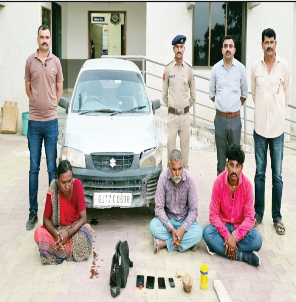
અગાઉ અંજારમાં તાંત્રિક વિધિ અને દોષના નામે કરી હતી ઠગાઈ

ભુજ - કચ્છઉદય : તમારી જિંદગીમાં નડતર છે, ધંધામાં ખોટ જાય છે, તેમ કહીને લોકોને વિશ્વાસમાં લઈ વિધિ કરવાના નામે ભુજમાં ફરતી ટોળકીને પથ્થર પોલીસે ઝડપી પાડી હતી. આરોપીઓ સામે રાજકોટ વિસ્તારમાં અલગ અલગ ૧૧ જેટલા ગુના નોંધાયેલા છે.