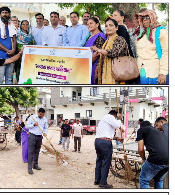
ભુજ તાલુકાના સુખપર ગામેથી સ્વચ્છતા સપ્તાહ અભિયાનનો પ્રારંભ : સ્વચ્છતા રેલી સાથે સામૂહિક સ્વચ્છતા અભિયાનમાં મોટી સંખ્યામાં ગ્રામજનો જોડાયા : સફાઈ કર્મચારીઓનું સન્માન કરાયું

ભુજ - કચ્છઉદય : કચ્છમાં ૧૪ જૂના સુધી ઉજવવામાં આવનાર સ્વચ્છતા સપ્તાહ અભિયાનનો ભુજ તાલુકાના સુખપર ગામેથી જિલ્લા કલેક્ટર અનિલ રાણાવસિયાના હસ્તે સ્વચ્છતા સપ્તાહનું પ્રસ્થાન કરાવી અભિયાનનો શુભારંભ કરવામાં આવ્યો હતો. આ પ્રસંગે જિલ્લા કલેક્ટરે સ્વચ્છતા જાણવામાં જનભાગીદારીના મહત્વ પર ભાર મૂકતા જણાવ્યું હતું કે, સ્વચ્છ ગામ અને સ્વસ્થ સમાજની નિર્માણ માટે દરેક નાગરિકની સક્રિય ભાગીદારી જરૂરી છે. સ્વચ્છતા માત્ર અભિયાન નહીં પરંતુ જીવનશૈલી બનવી જોઈએ. આ ટાંકણે કલેક્ટર દ્વારા સફાઈ કર્મચારીઓનું સન્માન કરવામાં આવ્યું હતું. રેલી બાદ ગામમાં સામૂહિક સ્વચ્છતા અભિયાન હાથ ધરવામાં આવ્યું હતું, જેમાં તમામ ઉપસ્થિતોએ શ્રમદાન કરી જાહેર સ્થળો, રસ્તાઓ તથા આસપાસના વિસ્તારોની સફાઈ કરી હતી. સ્વચ્છતા પ્રત્યે જનજાગૃતિ લાવવા તેમજ ગામોને વધુ સ્વચ્છ અને સુંદર બનાવવા માટે સૌએ સંકલ્પ પણ લીધો હતો. સ્વચ્છ ભારત મિશન (ગ્રામીણ) અંતર્ગત સમગ્ર સપ્તાહ દરમિયાન જિલ્લાના વિવિધ ગામોમાં સ્વચ્છતા, ધન અને પ્રવાહી કચરા વ્યવસ્થાપન, વાસ્તિક મુક્તિ, વૃક્ષારોપણ તથા જનજાગૃતિના વિવિધ કાર્યક્રમોનું આયોજન કરવામાં આવશે. આ પ્રસંગે જિલ્લા ગ્રામ