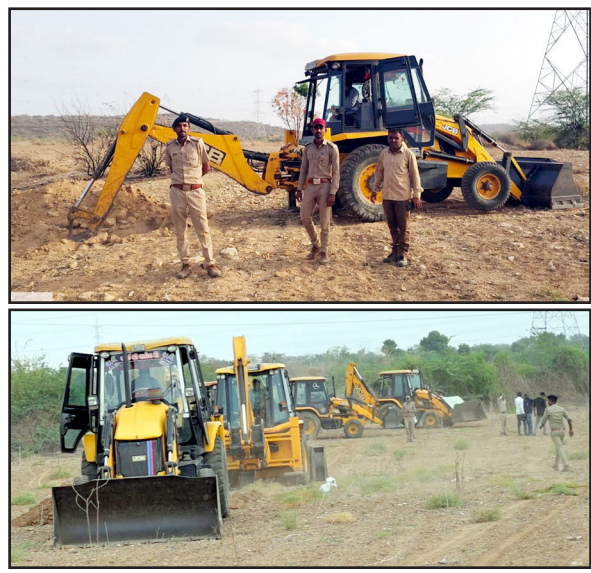
વન વિભાગ ખાણ... 'ગોર' જમીનના દબાણ દૂર કરવા વહીવટી તંત્ર કચારે જાગશે ?