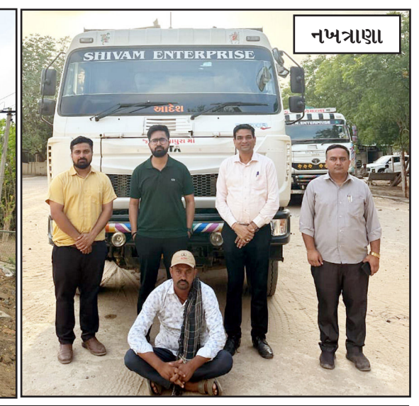
ખેતીજ ચોરી રોકવા મોટા ઉપાડે બનેલી ટાર્ક ફોર્સનું 'સુરસુરીયુ'