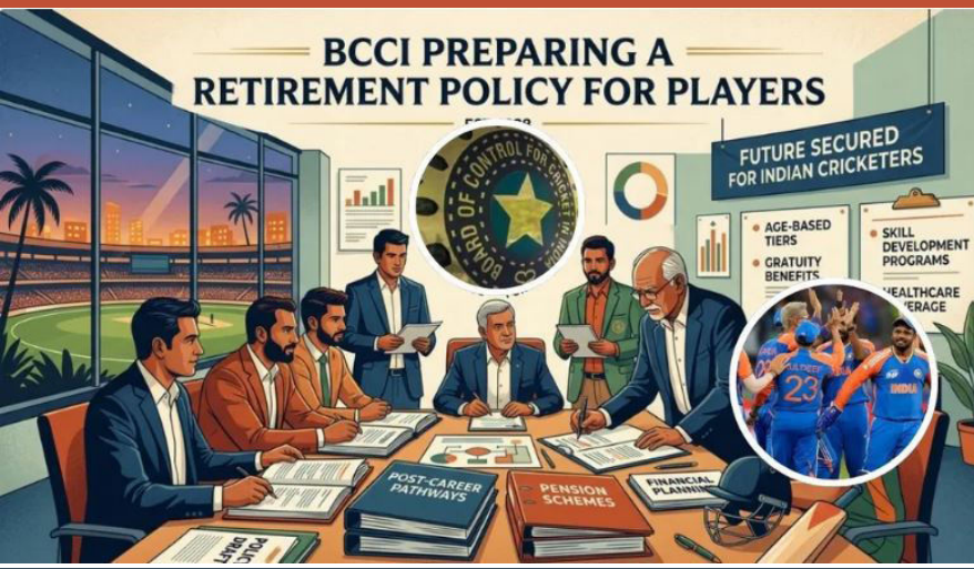
BCCI PREPARING A RETIREMENT POLICY FOR PLAYERS