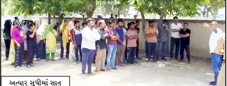
અત્યાર સુધીમાં સાત જેટલા બાંગ્લાદેશી નાગરિક ગેરકાયદે રહેતા હોવાનું સામે આવ્યું : ૧૫ ટીમો દ્વારા તપાસ કરાઈ

ભુજ - કચ્છઉદય : ગુજરાતમાં ગેરકાયદેસર રીતે વસવાટ કરતા બાંગ્લાદેશી નાગરિકોને શોધી કાઢવા માટે પોલીસ ઝુંબેશ હાથ પાડી છે. અમદાવાદ, વડોદરા, રાજકોટ, સુરતની સાથે કચ્છમાં પણ આ કાર્યવાહી કરવામાં આવી છે. પશ્ચિમ કચ્છમાં ૮૦ જેટલા શંકાસ્પદ બાંગ્લાદેશીઓની અટક કરી પુછપરછ કરવામાં આવી રહી છે. જેમાં સાત જેટલા બાંગ્લાદેશી નાગરિક ગેરકાયદે રહેતા હોવાનું સામે આવ્યું હતું. સમગ્ર રાજ્યમાં એકસાથે લેવાયેલા આ એકશનથી ગેરકાયદેસર પુસાણાઓ કરીને રહેતા તત્વોમાં ભારે ફફડાટ વ્યાપી ગયો છે. પોલીસ હાલ આ તમામ લોકોના સ્થાનિક કનેક્શન અને બોગસ