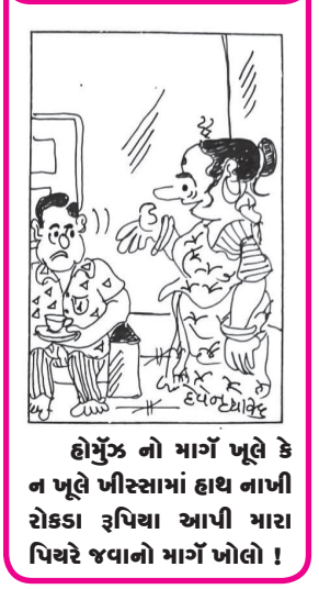
હોમ્સ નો માર્ગ ખૂલે કે ન ખૂલે ખીરસામાં હાથ નાખી રોકડા રૂપિયા આપી મારા પિયરે જવાનો માર્ગ ખોલો !