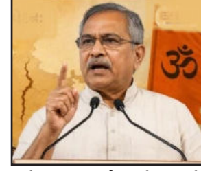
પોટી માહિતી ફેલાવવામાં આવે છે. પરંતુ વાર્તાવિક્રમતા એ છે કે ઈચ્છુ કોઈપણ સમાજ, સમુદાય અથવા વ્યક્તિ પ્રત્યે દેશ રાખતું નથી. તેમણે જણાવ્યું કે સંઘ સમાજના દરેક વર્ગને સાથે લઈને ચાલવામાં વિશ્વાસ રાખે છે અને Dialogue તથા Discussion દ્વારા સમસ્યાઓના ઉકેલ શોધવાનું સમર્થન કરે છે. RSS સરકાર્યવાદ દત્તાનેય હોસબલે દ્વારા પાકિસ્તાન સાથે સંવાદ અનુસંધાન પાના નં.૪ પર