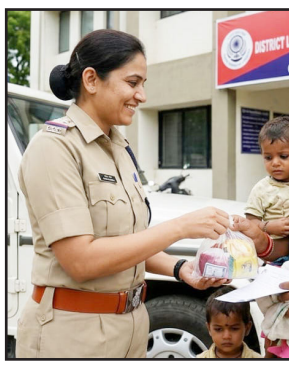
સિવિલ હોસ્પિટલ ખસેડવામાં આવી. અમદાવાદ સિવિલ હોસ્પિટલમાં તેણે પુત્રને જન્મ આપ્યો. સારવાર પૂરી થયા પછી આ મહિલા કેદીને તેના નવજાત શિશુ સાથે પાછી નડિયાદ જિલ્લા જેલમાં લઈ આવવામાં આવી. આ મહિલા કોટી કામના કેદી હવે બે વર્ષનાં બાળક અને ચાર દિવસનાં નવજાત શિશુ સાથે જેલમાં રહેતી હતી.

ગાંધીનગર: વલીવટીતંત્ર જ્યારે માનવીય સંવેદનાને ઉજાગર કરે છે ત્યારે ભલભલાની આંખો બીજાં જાય છે. આવી જ ઘટના નડિયાદ જિલ્લા જેલમાં બની છે. જેલમાં રહેલી એક શ્રમિક પરિવારની મહિલા આરોપીએ બાળકને જન્મ આપ્યો ત્યારે તેને તેણીના પરિવારમાંથી કોઈ લેવા આવ્યું નહીં. આ સમયે ગુજરાત પોલીસ તેની વાલી બની અને ખાખીમાં ધબકતા હૃદયનો પરિચય કરાવ્યો ને એક પરિવારની ભૂમિકા ભજવીને ગુજરાત પોલીસ છેક મધ્યપ્રદેશ મુકવા ગઈ.