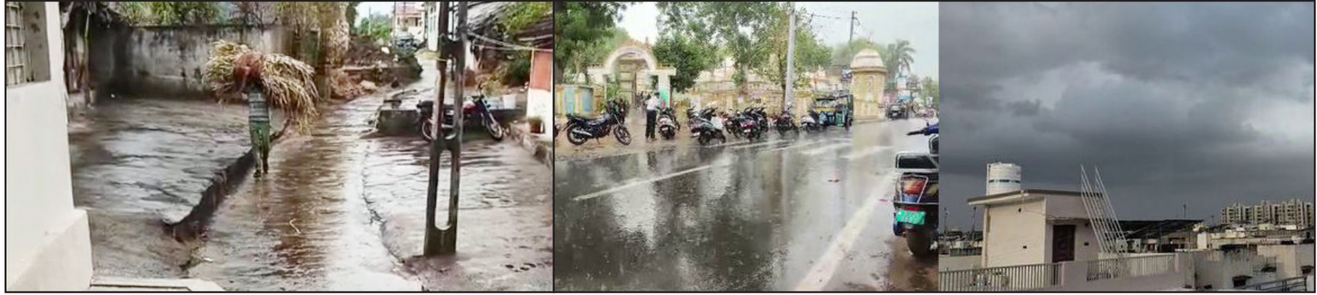
ગાંધીનગર : ગુજરાતમાં કરવામાં આવેલી પ્રિ-મોન્સુન અક્ષરશ:સાચી સાબિત થઈ રહી બાદ હવે મધ્ય ગુજરાતના મેઘરાજાએ ધમાકેદાર ઈનિંગ જિલ્લાઓમાં કાળાડિબાંગ ધોધમાર વરસાદ ખાબકતાં ગયો છે.અરવલ્લી જિલ્લાના સમગ્ર પંથક કંડકગાર બની અનુસંધાન પાના નં.૪ પર

ઉત્તર અને મધ્ય ગુજરાતના સરહદી પંથકોમાં મેઘરાજનું આગમન, વહેલી સવારથી વરસાદી માહોલ