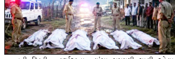
નવી દિલ્હી : કર્ણાટકના લાંબા સમયથી ચાલી રહેલા વિજયાપુરા જિલ્લામાંથી એક જમીન વિવાદના કારણે એક અત્યંત લોહિયાળ અને માનવતાને શરમાવે તેવી ઘટના સામે આવી છે. અહીં અનુસંધાન પાના નં.૪ પર