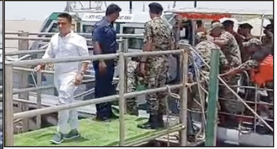
ગુજરાત રાજ્યના નાયબ મુખ્યમંત્રી શ્રી હર્ષ સંઘવી પણ શ્રી શાહેની સાથે હરામીનાળાની સમીક્ષા-નિરીક્ષણમાં જોડાયા

કેન્દ્રીય ગૃહ અને સહકાર મંત્રી અમિત શાહે કચ્છના હરામીનાળા વિસ્તારમાં BSF ટાવર-૧૧૭૦ નજીક આવેલા કન્ટ્રોલ રૂમમાં PTZ કેમેરા ફીડનું નિરીક્ષણ કર્યું હતું. ત્યારબાદ હરામીનાળા વિસ્તાર અને શિપ મારફતે સરહદી વિસ્તારોની મુલાકાત લઈ સુરક્ષા વ્યવસ્થાની સમીક્ષા કરી હતી.