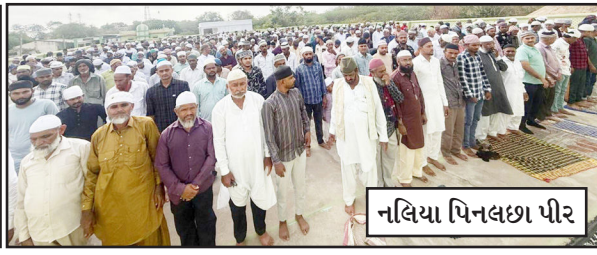
નલિયા પિનલણ પીર