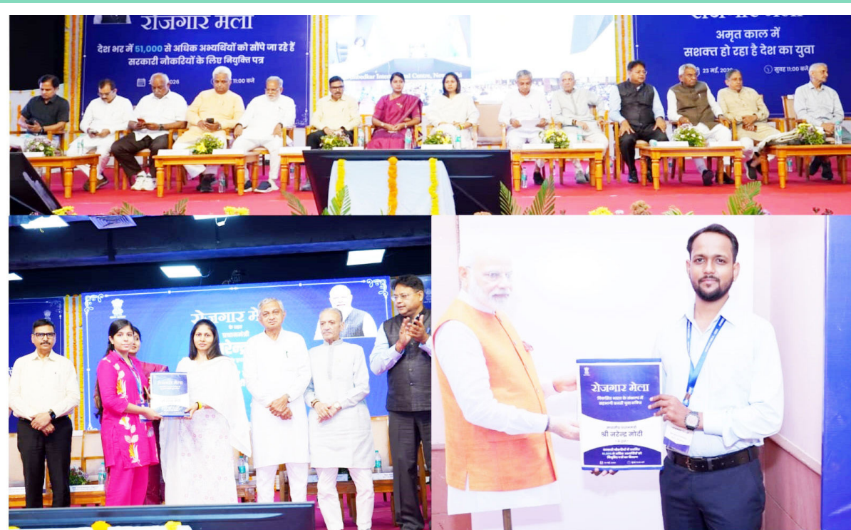
વડાપ્રધાન નરેન્દ્ર મોદીએ દેશમાં આયોજિત ૧૯મા રોજગાર મેળા હેઠળ ૫૧ હજારથી વધુ યુવાનોને નિમણૂક પત્રો સોંપ્યા

અમદાવાદ - કચ્છઉદ્ય : વડાપ્રધાન નરેન્દ્ર મોદીએ ૨૩ મેના વીડિયો કોન્ફરન્સિંગના મારફતે ૧૯મા રોજગાર મેળા હેઠળ દેશભરમાં ૫૧,૦૦૦થી વધુ નવી નિમણૂક મેળવનારા યુવાનોને નિમણૂક પત્રો વિતરણ કર્યા હતા. વડાપ્રધાને નવી નિમણૂક મેળવનારા કર્મચારીઓને સંબોધિત કરતા તેમને રાષ્ટ્ર નિર્માણમાં સક્રિય યોગદાન આપવાની હાકલ કરી. તેમણે કહ્યું કે ભરતી પ્રક્રિયામાં હવે પારદર્શિતા આવી છે તથા તમામ પસંદગી મેરિટના આધારે કરવામાં આવી રહી છે. સાથે જ નિમણૂક પ્રક્રિયા પહેલાની સરખામણીમાં વધુ ઝડપી અને સરળ બની છે. ૧૮મો રોજગાર મેળો દેશભરના ૪૭ સ્થળો પર આયોજિત કરવામાં આવ્યો, જેમાં વિવિધ ૧૯ વિભાગોમાંથી પસંદ થયેલા ઉમેદવારોને નિમણૂક પત્રો આપવામાં આવ્યા. રેલવે મંત્રાલય, ગૃહ મંત્રાલય, આરોગ્ય અને પરિવાર કલ્યાણ મંત્રાલય, નાણાકીય સેવા વિભાગ, ઉચ્ચ શિક્ષણ વિભાગ સહિત કેન્દ્ર સરકારના વિવિધ મંત્રાલયો અને વિભાગોમાં પસંદ થયેલા ઉમેદવારોને નિમણૂકો આપવામાં આવી. રોજગાર મેળો અભિયાન શરૂ થયા પછીથી અત્યાર સુધીમાં દેશભરમાં આયોજિત વિવિધ રોજગાર મેળાઓના મારફતે આશરે ૧૨.૫૦ લાખ નિમણૂક પત્રો વિતરિત કરી દેવામાં આવ્યા છે. અમદાવાદમાં આયોજિત રોજગાર મેળામાં મુખ્ય અતિથિ, માનનીય યુવા બાબતો અને રમતગમત રાજ્યમંત્રી, ભારત સરકાર, રક્ષા નિખિલ ખડસેએ પોતાના સંબોધનમાં કહ્યું કે આજે ગુજરાત સહિત દેશના વિવિધ રાજ્યોમાં વડાપ્રધાન નરેન્દ્રભાઈ મોદીના નેતૃત્વમાં રોજગાર મેળાનું આયોજન કરવામાં આવી રહ્યું છે. તેમણે કહ્યું કે આ પૂર્વે ૧૮ રોજગાર મેળાઓનું સફળ આયોજન કરવામાં આવી ચૂક્યું છે, જેમની મારફતે આશરે ૧૨ લાખ યુવાનોને કેન્દ્ર સરકાર દ્વારા રોજગારની તકો પૂરી પાડવામાં આવી છે. આજે પણ આ રોજગાર મેળા મારફતે