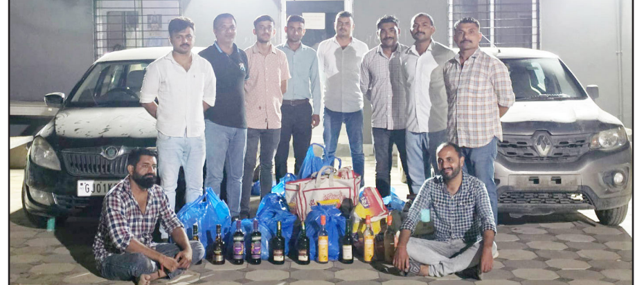
આદિપુર : પૂર્વ કચ્છમાં પ્રોહિબિશન અને જુગાર જેવી ગેરકાયદેસર પ્રવૃત્તિઓ પર લગામ કસવા માટે પૂર્વ કચ્છ પોલીસ દ્વારા અકામક અભિયાન ચલાવવામાં આવી રહ્યું છે. આ અંતર્ગત, મે. પોલીસ મહાનિરીક્ષક ચિરાગ કોરડીયા અનુસંધાન પાના નં.૫ પર