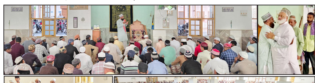
ગાંધીધામ : પવિત્ર ઈદ-ઉલ-અઝહા (બકરી ઈદ) નિમિત્તે સુંદરપુરી સ્થિત મસ્જિદે તયબાહ ખાતે મુસ્લિમ સમાજ પોતાના બાળકો સાથે વહેલી સવારે ઈદની નમાજ અદા કરવા બહોળી સંખ્યામાં હાજર રહ્યો હતો.