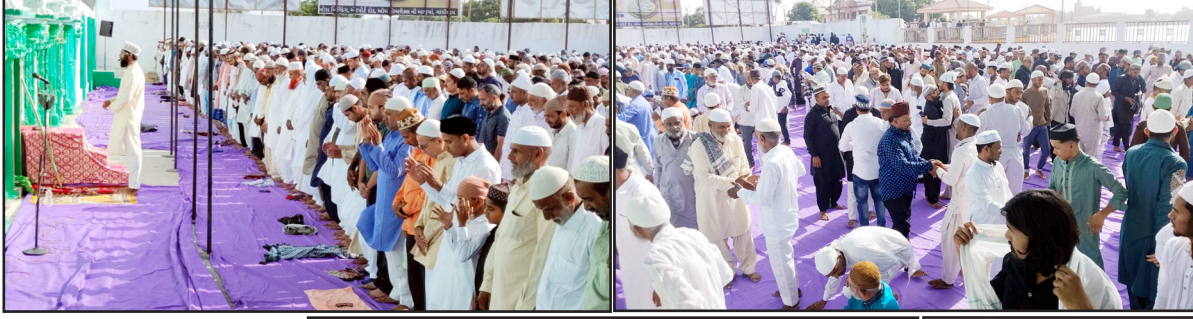
કોમી એકલાસની ભાવના સાથે મુસ્લિમ બિરાદરોએ અદા કરી ઈદની નમાજ

ભુજ - કચ્છઉદય : કચ્છના જિલ્લા મથક ભુજમાં આજે ઈદ-ઉલ-અઝહાનો તહેવાર ભારે ઉત્સાહ અને રૂઢાની અંદાજમાં ઉજવવામાં આવ્યો હતો. સવારના સમયે શહેરની મુખ્ય ઈદગાહ તેમજ વિવિધ મસ્જિદોમાં ઈદની વિશેષ નમાજ અદા કરવા માટે મુસ્લિમ બિરાદરોની ભીડ ઉમટી પડી હતી. મસ્જિદો તકબીરના અવાજોથી ગુંજ ઊઠી હતી અને મુસ્લિમ બિરાદરોએ ખુદાની બારગાહમાં સજદા કરી દેશમાં અમન અને શાંતિ માટે દુઆઓ માંગી હતી. નમાજ બાદ એકબીજાને ગળે મળીને ઈદ મુબારકની મુબારકબાદી આપવાની પરંપરાનું સુંદર મંજર જોવા મળ્યું હતું. ભુજના વિવિધ વિસ્તારોમાં લોકોએ પોતાના અગીઓ અને મિત્રોને ઘરે આમંત્રિત કરી ઈદની ખાસ વાનગીઓની લિક્કત માણી હતી. સમગ્ર શહેરમાં ઈદની રોનક જોવા મળી હતી અને નવા વસ્ત્રોમાં સજ્જ લોકો એકબીજાને ગળે મળી પુશીઓ વહેંચતા નજરે પડ્યા હતા. આ તહેવાર માત્ર એક ધાર્મિક પર્વ જ નહીં, પરંતુ ભુજમાં વર્ષોથી જળવાયેલી કોમી એકલાસની ભાવના અને ભાઈચારાનું પ્રતીક બની રહ્યો હતો. વહીવટી તંત્ર દ્વારા