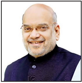
વિશાળ સંખ્યામાં કાર્યકર્તાઓ એકત્રિત થઈને તેમનું ઉષ્માભર્યું અભિવાદન કરશે. આ કાર્યક્રમ ભુજના એરપોર્ટ

ભુજ - કચ્છ ઉદય : દેશના કેન્દ્રીય ગૃહ અને સહકાર મંત્રી અમિતભાઈ શાહના કચ્છ પ્રવાસને લઈને સમગ્ર જિલ્લામાં ઉત્સાહનો માહોલ છવાઈ ગયો છે. રાષ્ટ્રીય સુરક્ષા અને સરહદી સલામતીના મહત્વના મુદ્દાઓ પર સમીક્ષા કરવા માટે આજે પંચારી રહેલા કેન્દ્રીય ગૃહમંત્રીનું સ્વાગત કરવા માટે કચ્છના ભાજપના કાર્યકર્તાઓ અત્યંત ઉત્સાહી છે.