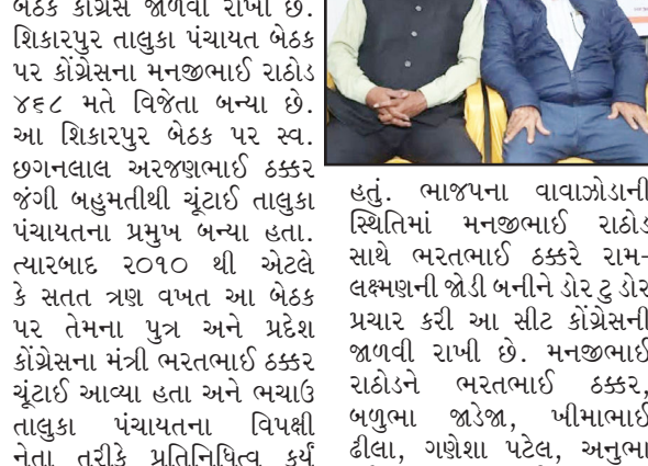
સોમનાથ, દારકા અને ગંગા જિલ્લાના પોલીસ અધિકારી ઉપસ્થિત રહ્યા હતા.