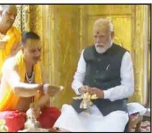
કાશી વિશ્વનાથમાં પોડશોપચાર પદ્ધતિથી કરી પૂજા-અર્ચના

નવી દિલ્હી : પીએમ મોદીની વારાણસી મુલાકાતનો આજે બીજો દિવસ છે. પ્રધાનમંત્રી નરેન્દ્ર મોદી કાશી વિશ્વનાથ મંદિર પહોંચ્યા છે. મોદીએ બાબા વિશ્વનાથની ખાસ (પૂજા વિધિ) કરી હતી. પીએમ મોદી વારાણસીમાં વિવિધ સ્થળોએ બનાવેલા વિવિધ ઔપચારિક સ્વાગત કમાનોમાંથી પસાર થઈને મંદિર પહોંચ્યા. અહીં પૂજા સમારોહ પછી, પીએમ મોદી ગંગા એક્સપ્રેસ વેના ઉદ્ઘાટન માટે હરદોઈ જશે. પીએમ મોદી મંદિર સંકુલમાં પ્રવેશતા જ, સમગ્ર પરિસર વૈદિક મંત્રોના જાપથી ગુંજી ઉઠ્યું. આ સમય દરમિયાન, ઘણા પૂજારીઓ હરોળમાં ઉભા હતા, દ્વારા સંકુલમાં પ્રવેશ્યા. તેમણે તેમનું સ્વાગત કરવા માટે ભેગા થયેલા પૂજારીઓનો પણ ખાસ આભાર માન્યો. પીએમ મોદીએ પોડશોપચાર વિધિ પદ્ધતિ અનુસાર બાબા વિશ્વનાથની પૂજા કરી હતી. તેમણે પહેલા દેવતાને આહ્વાન કર્યું. ત્યારબાદ, તેમણે પદ અને અર્ધ અર્પણ કર્યું હતું. મોદીએ તમામ નિર્ધારિત વિધિઓનું પાલન કરીને, તેમણે ભગવાન બાબા વિશ્વનાથને પવિત્ર ગંગાજળ, હળદરનું પાણી, અક્ષત (પવિત્ર ચોખાના દાણા) અને દૂધનો ઉપયોગ કરીને અભિષેક કર્યો હતો. કાશી વિશ્વનાથમાં પોડશોપચાર પદ્ધતિથી કરી પૂજા-અર્ચના ડમરુ વગાડતા હતા; તેઓએ હાથમાં મોટો ડમરુ પકડ્યો હતો. પીએમ મોદી શ્રદ્ધાના સંકેત રૂપે હાથ જોડીને મુખ્ય દરવાજા