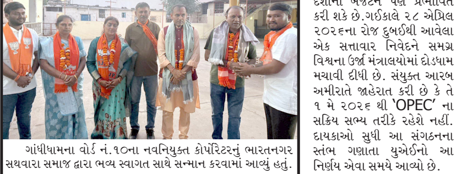
ગાંધીધામના વોર્ડ નં. ૧૦ના નવનિયુક્ત કોર્પોરેટરનું ભારતનગર સથવારા સમાજ દ્વારા ભવ્ય સ્વાગત સાથે સન્માન કરવામાં આવ્યું હતું.

નવી દિલ્હી :૨૯ એપ્રિલ ૨૦૨૬ના આજના દિવસે વૈશ્વિક ભારતની અને અર્થતંત્રમાં એક ભૂંધક સમાન સમાચાર સામે આવ્યા છે. સંયુક્ત આરબ અમીરાત એ પેટ્રોલિયમ નિકાસ કરતા દેશોના શક્તિશાળી સંગઠન 'OPEC' માંથી બહાર નીકળવાનો ઐતિહાસિક નિર્ણય લીધો છે. આ નિર્ણય માત્ર તેલના ભાવોને જ નહીં, પરંતુ ભારત જેવા વિશાળ આયાતકાર દેશોના બજેટને પણ પ્રભાવિત કરી શકે છે. ગઈકાલે ૨૮ એપ્રિલ ૨૦૨૬ના રોજ દુબઈથી આવેલા એક સત્તાવાર નિવેદન સમગ્ર વિશ્વના ઈર્ષ મંત્રાલયોમાં દ્રોષામ મચાવી દીધી છે. સંયુક્ત આરબ અમીરાતે જાહેર કરી છે કે તે ૧ મે ૨૦૨૬ થી 'OPEC' ના સક્રિય સભ્ય તરીકે રહેશે નહીં. દારકાઓ સુધી આ સંગઠનના સંભવ ગણાતા યુએઈએ આ નિર્ણય એવા સમયે આવ્યો છે.