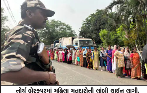
નોર્થ બેરકપુરમાં મહિલા મતદારોની લાંબી લાઈન લાગી.

બંગાળમાં ચૂંટણી મતદાન વચ્ચે હોબાળો : ફાટામાં ઈવીએમમાં ગડબડનો ભાજપના ઉમેદવારે લગાવ્યો આરોપ : મશીનના ભટનો કામ કરતા નથી : ભાજપના ઉમેદવાર વિકાસ સરદાર પર હુમલો થયો : સુરક્ષા કર્મીઓએ સ્થિતિ કાબુમાં મેળવી : ગાડીમાં પણ થઈ તોડફોડ 11.00 વાગ્યા સુધી 39.97 ટકા મતદાન નોંધાયું