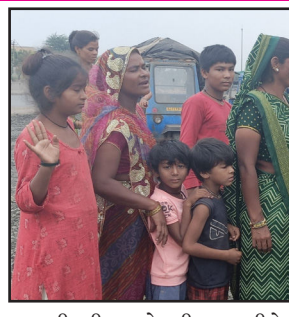
દુધ-ખીચડી, રોટલી, પશીને ચણ વિગેરે જીવદયાના કાર્યો કરાયા હતા. ૨૦૦ જેટલા શ્રમજીવીઓને મિથાન-નમકીન અને કુટુંબ વિતરણ કરાયું હતું. વિવિધ સંસ્થામાં દિવ્યાંગો, મનોરોગીઓને ભાવતા કોચન આપવામાં આવ્યા હતા અને નિ:શુલ્ક છાશ કેન્દ્ર પરથી હજારો જરૂરતમંદ લોકોને કાળજાળ ગરમીમાં ઉનાળાનું અમુત છાશનું પાન કરાવાયું હતું અને વિશ્વ શાંતિ માટે મંત્રાધીરાજ