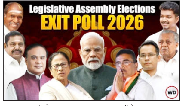
દાવ પર લાગી છે. અસમની ૧૨૬ સીટો પર ભાજપા અને કોંગ્રેસ વચ્ચે મુકાબલો છે તો તમિલનાડુની

નવી દિલ્હી : પશ્ચિમ બંગાળમાં બીજા ચરણની ૧૪૨ સીટો પર મતદાન પછી બુધવારે સાંજે ૭ વાગ્યાથી પાંચ રાજ્યો (પશ્ચિમ બંગાળ, અસમ, કેરલ, તમિલનાડુ અને પોંડિચેરી) માં થયેલ વિધાનસભા ચૂંટણી માટે એકિઝટ પોલ બુધવારે શરૂ થશે. પશ્ચિમ બંગાળની ૨૮૪ સીટો પર ભાજપા અને તુણમૂળ કોંગ્રેસમાં કડક મુકાબલો છે. અહીં પ્રધાનમંત્રી નરેન્દ્ર મોદી, અમિત શાહ અને મમતા બેનર્જીની પ્રતિષ્ઠા પર એલડીએફ અને યૂડીએફ અને યૂડીએફ વચ્ચે કોટાની ટક્કર થઈ શકે છે. તમિલનાડુ અને કેરલમાં ભાજપાએ પણ પૂરૂ જોર લગાવ્યું છે. અસમ, કેરલ, તમિલનાડુ અને પોંડિચેરીમાં મતદાન થઈ ચુક્યું છે. આવામાં બધાની નજર એકિઝટ પોલ પર લાગી છે. જો કે અનેકવાર ચૂંટણી પરિણામ એકિઝટ પોલના પરિણામથી જુદા પણ આવ્યા છે. હાલ બધી એજંસીઓના એકિઝટ પોલના પરિણામ જાણવા માટે બન્યા રહ્યો વેબદુનિયા પર. ૨૩૪ સીટો પર ડ્રમુક, અમ્નાદ્રમુક અને ટીવીકેમાં ત્રિકોણીય મુકાબલો જોવા મળી રહ્યો છે. કેરલની ૧૪૦ સીટો