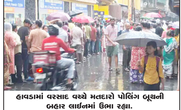
હાવડામાં વરસાદ વચ્ચે મતદારો પોલિંગ બૂથની બહાર લાઈનમાં ઉભા રહ્યા.

વહેલી સવારથી જ મતદારોએ પર લાંબી લાઈનો લગાવી મતદાન માટે મતદાન મથકો ધીબી હતી. બીજા તબક્કામાં યોજાયેલા મતદાન મા પ્રથમ મતદાન નોંધાયું હોવાના બે કલાકમાં ૧૮.૩૯ ટકા અનુસંધાન પાના નં. ૪ પર