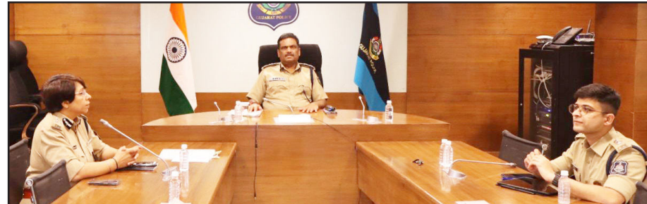
આ પહેલનો હેતુ માત્ર કાયદો અને વ્યવસ્થા જાળવવાનો જ નહીં, પરંતુ ગુજરાતની સુલાકાતે આવતા દેશ-વિદેશના પર્યટકોને એક સુરક્ષિત અને ટુરિસ્ટ ફ્રેન્ડલી વાતાવરણ પૂરું પાડવાનો છે: ડો. કે.એલ.એન.રાવ : રાજ્યના પોલીસ વડા ડો. કે.એલ.એન.રાવની અધ્યક્ષતામાં યોજાઈ મહત્વપૂર્ણ બેઠક હતો. નાયબ મુખ્યમંત્રી હર્ષ પ્રથમ તબક્કે ગીર સોમનાથ, મુખ્ય પ્રવાસન જિલ્લાઓમાં સંઘવીના માર્ગદર્શન હેઠળ દેવભૂમિ દ્વારકા અને ડાંગ જેવા અનુસંધાન પાના નં. ૪ પર

ગાંધીનગર : ગુજરાતના મુખ્ય પર્યટન સ્થળો પર આવતા પ્રવાસીઓની સુરક્ષા, સુવિધા અને સુખદ અનુભવમાં વધારો કરવાના ઉદ્દેશ્ય સાથે રાજ્યના પોલીસ વડા ડો. કે.એલ.એન. રાવની અધ્યક્ષતામાં એક ઉચ્ચ સ્તરીય બેઠક યોજાઈ હતી. આ બેઠકનો મુખ્ય ઉદ્દેશ DG & IG કોન્ફરન્સની ભલામણો મુજબ રાજ્યના મહત્વના પ્રવાસન જિલ્લાઓમાં સમર્પિત 'ટુરિસ્ટ પોલીસ સ્ટેશન' કાર્યરત કરવાનો આ પહેલનો હેતુ માત્ર કાયદો અને વ્યવસ્થા જાળવવાનો જ નહીં, પરંતુ ગુજરાતની સુલાકાતે આવતા દેશ-વિદેશના પર્યટકોને એક સુરક્ષિત અને ટુરિસ્ટ ફ્રેન્ડલી વાતાવરણ પૂરું પાડવાનો છે: ડો. કે.એલ.એન.રાવ : રાજ્યના પોલીસ વડા ડો. કે.એલ.એન.રાવની અધ્યક્ષતામાં યોજાઈ મહત્વપૂર્ણ બેઠક હતો. નાયબ મુખ્યમંત્રી હર્ષ પ્રથમ તબક્કે ગીર સોમનાથ, મુખ્ય પ્રવાસન જિલ્લાઓમાં સંઘવીના માર્ગદર્શન હેઠળ દેવભૂમિ દ્વારકા અને ડાંગ જેવા અનુસંધાન પાના નં. ૪ પર