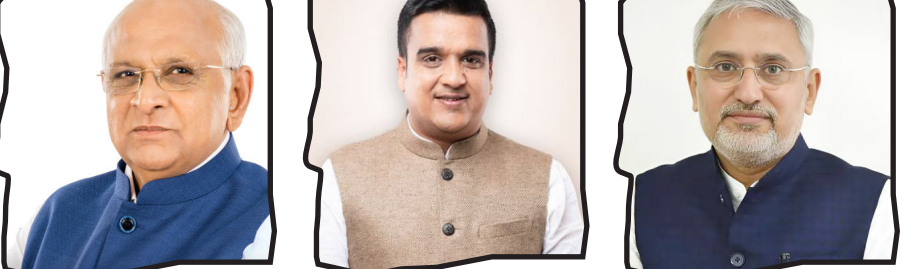
સીએમ-ડે. સીએમ-પ્રદેશ અધ્યક્ષ સહિતનાઓ રહેશે ઉપસ્થિત : ભવ્ય જીત બદલ કાર્યકર્તાઓની ભુમિકાને બિરદાવાશે : ભોજન સમારોહનું પણ આયોજન

ગાંધીનગર : સ્થાનિક સ્વરાજ્યની ચૂંટણીમાં ભાજપનો ભગવોરાજ્યમાં ઠેર ઠેર લહેરાઈ જવા પામ્યો છે. ૨૦૨૧ કરતા પણ સાડે પરીણામ ભાજપે મેળવી લીધું છે. દરમિયાન જ મળતી માહિતી અનુસાર કમલમ મધ્યે પ્રદેશ ભાજપ દ્વારા આ જીતને વધાવવા માટે કાર્યકર્તાઓ સાથે એક બેઠકનું આયોજન કરવામાં આવ્યું છે. ભોજન સમારોહ સાથે યોજાઈ રહેલી આ બેઠકમાં રાજ્યના મુખ્યપ્રધાન અનુસંધાન પાના નં. ૪ પર સીએમ-ડે. સીએમ-પ્રદેશ અધ્યક્ષ સહિતનાઓ રહેશે ઉપસ્થિત : ભવ્ય જીત બદલ કાર્યકર્તાઓની ભુમિકાને બિરદાવાશે : ભોજન સમારોહનું પણ આયોજન