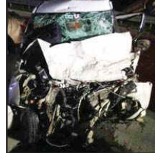
એટીંગા કાર હવામાં ઉછળીને હાઈવે પરના બેરિકેડ પર પડી હતી જ્યારે મુસાફરો કારમાંથી ફૂટીને રોડ પર પડી ગયા હતા. બીજી કાર કચરાના ઢગલાની જેમ બીજી તરફ પડી હતી. અકસ્માત બાદ પોલીસ ઘટનાસ્થળે પહોંચી હતી અને ૭ લોકોના મૃતદેહ હાઈવે પર લોહીથી લથપથ જોવા મળ્યા હતા. અકસ્માતની માહિતી મળતા જ સમૂદ્ધિ હાઈવે પોલીસ અને જાલના પોલીસ ઘટનાસ્થળે પહોંચી ગઈ હતી. કારને હટાવવા માટે કેન બોલાવવામાં આવી હતી. ઘાયલોને સારવાર માટે જિલ્લા હોસ્પિટલમાં મોકલવામાં આવ્યા છે.

મુંબઈ : સમૂદ્ધિ એક્સપ્રેસ વે પર એક દર્દનાક અકસ્માતની ઘટના સામે આવી છે. મુંબઈથી લગભગ ૪૦૦ કિમી દૂર જાલના જિલ્લામાં સમૂદ્ધિ એક્સપ્રેસ વે પર ૬૨૩ વાંચી ગામ નજીક ગઈકાલે રાત્રે મુંબઈ-નાગપુર એક્સપ્રેસ વે અથવા સમૂદ્ધિ એક્સપ્રેસ વે પર બે કાર વચ્ચે જોરદાર ટક્કર થઈ હતી. આ દુર્ઘટનામાં પ્રાથમિક વિગતો મુજબ ૭ લોકોના મોત થયા છે અને પાંચ ઘાયલ થયા છે. અકસ્માતની જાણ આસપાસના ગામોના લોકો સુધી પહોંચતા જ ચારેબાજુ અકરા-તકરીનો માહોલ સર્જ્યો હતો. આ અકસ્માત રાત્રે લગભગ ૧૧ વાગે થયો જ્યારે એક સ્વિફ્ટ ડિઝાઇર કાર ઈંધણ ભર્યા બાદ ખોટી દિશામાંથી હાઈવે પર ઘૂસી ગઈ અને નાગપુરથી મુંબઈ જઈ રહેલી આઈગા સાથે અથડાઈ હતી. આ તરફ ટક્કર એટલી જોરદાર હતી કે