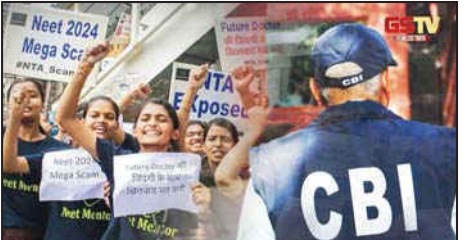
ગાંધીનગર : દેશભરમાં મેડીકલ પ્રવેશ માટેની