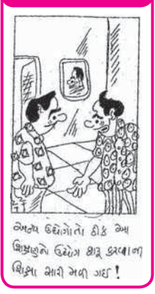
એન્યુ ઉદ્યોગો તો કીક આ પ્રિયજીવને ઉદ્યોગ શ્રી કચ્છાળી શિક્ષા મારી અગી ગઈ !