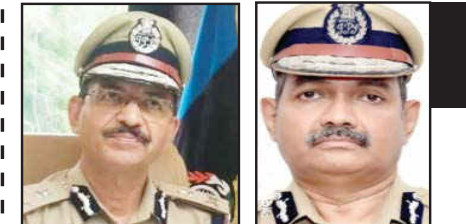
(પ્રતિનિધિ દ્વારા) ગાંધીનગર : સુત્રો પાસેથી પ્રાપ્ત વિગતો મુજબ કેન્દ્ર સરકારે જુદા જુદા રાજ્યોના ૧૧ જટલા આઈપીએસ