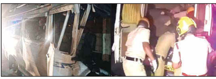
ધડાકાભેર અથડાયો હતો. ટક્કર એટલી જોરદાર હતી કે ટ્રાવેલરનો આગળનો ભાગ સંપૂર્ણ રીતે ચકનાચૂર થઈ ગયો હતો. આગળ બેઠેલા લોકોના મૃતદેહ ચોટી ગયા. ઘટનાની

(એજન્સી દ્વારા) નવી દિલ્હી : કર્ણાટકમાં શુક્રવારે ૨૮ જૂનના રોજ એક ભયાનક અકસ્માત થયાના સમાચાર સામે આવી રહ્યા છે. રાજ્યના હાઈવે જિલ્લામાં પુણે-બેંગલુરુ નેશનલ હાઈવે પર એક માર્ગ અકસ્માતમાં ૧૩ લોકોના મોત થયા છે. આ અકસ્માત જિલ્લાના બગડી તાલુકામાં ગુટેનહલ્લી કોસ પાસે થયો હતો. આ માર્ગ અકસ્માતમાં ૭૯ એક બાળક સહિત ૧૩ લોકોએ જીવ ગુમાવ્યા છે. નેશનલ હાઈવે પર થયેલા અકસ્માતમાં ઘાયલ લોકોને હોસ્પિટલમાં દાખલ કરવામાં આવ્યા છે, જ્યાં તેમની સારવાર ચાલી રહી છે. જ્યારે તેમને ટ્રાવેલર પુણે-બેંગલુરુ નેશનલ હાઈવે પરથી પસાર થઈ રહ્યો હતો ત્યારે આ માર્ગ અકસ્માત થયો હતો. તે હાઈવે પર પાર્ક કરેલી ટ્રક સાથે