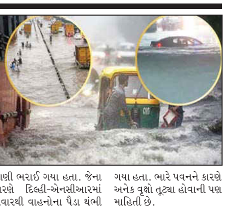
પાણી ભરાઈ ગયા હતા. જેના કારણે દિલ્હી-એનસીઆરમાં સવારથી વાહનોના પૈડા થંબી ગયા હતા. ભારે પવનને કારણે અનેક વૃક્ષો તૂટ્યા હોવાની પણ માહિતી છે.

(એજન્સી દ્વારા) નવી દિલ્હી : દેશની રાજધાનીમાં મેઘો આફતનો વરસાદ બની ગયો છે. અહીં વરસેલા વરસાદથી ઠેર ઠેર પાણી ફરી વળ્યું છે. શુક્રવારે વહેલી સવારે હવામાનમાં અચાનક પલટો આવ્યો અને ભારે પવન સાથે વરસાદ શરૂ થયો. નોઈડા, દિલ્હી અને આસપાસના વિસ્તારોમાં એક કલાકથી વધુ સમય સુધી ભારે વરસાદ પડ્યો હતો. આ વરસાદને કારણે ગરમીમાંથી રાહત મળી હતી તો અનેક જગ્યાએ રસ્તાઓ પર