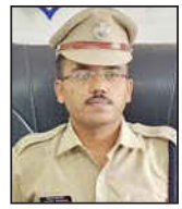
ગાંધીધામ : કાસેઝમાં એક્સપોર્ટ કરવાનું કહી અને રસ્તામાં પલટી મરી તેમાં માટી ભરી દેવામાં આવી એટલે સોપારીનો જથ્થો સગવળે કરવાનો કારણો અહીં દેખાઈ રહ્યો છે. ત્યારે જાણકારો કહી રહ્યા છે કે, જો સોપારીને આ રીતે બહાર કાઢી અને તેને ગમે ત્યા ખાનગી ગોડાઉનમાં એક્સપોર્ટના નામે ઘાલવી શકાતી હોય તો પછી બીજી કઈ વસ્તુઓ અહીં નહીં ઉતરતી હોય! આરટીએક્સ-વિસ્ફોટકનો જથ્થો કે પછી ડૂંબરા પણ આ રીતે નહીં ઠલવાઈ જતું હોય તેની શું ખાત્રી? ખરેખર આ બાબતે પૂર્વ કચ્છ એસપીશ્રીએ પણ ગંભીરતા દાખવવાની જરૂર છે.

સોપારી એક્સપોર્ટ કરવાના બદલે પલટી મારવાના કારણનાં પર્દાફાશ થવાપામ્યો છે. ભુધવારની રાત્રીના અમદાવાદ ડીઆરઆઈ દ્વારા આ કચ્છેનરોને અટકાવી અને તેને શુરુરે બપોરના કાસેઝમાં લાવી તેની નિયમ અનુસારની તપાસથીઓ હાથ ધરવામાં આવી હતી. કાસેઝની જે પેટીએ આ કચ્છેનરો લોડ ક્યાં હતા તેમાં બીલ ઓફ એન્ટીમાં સોપારી દેખાડાયેલી હતી પરંતુ જ્યારે ગઈકાલે એજન્સીએ કચ્છેનરો ખોલાવ્યા તો તેમાંથી માટી જ બહાર નીકળી આવી હતી અને તેના પરથી જ આ સોપારીને એક્સપોર્ટનું દેખાડી, માર્ગમાં પલટી મારી, ડ્યુટી ચોરી કરવાના કારણો પર્દાફાશ થવા પામી ગયો હતો. અમદાવાદ ડીઆરઆઈએ સ્થાનિક ડીઆરઆઈને સાથે રાખીને આ તમામ કામગીરી કરી હોવાનું મનાય છે. ગત સાંજે આ પ્રકરણમાં ત્રણ કચ્છેનર ઉપરાંત ત્રણ સ્થાનીક શપ્સોની પણ એજન્સીએ અટક કરી લીધી હોવાનું પણ બિનસત્તાવાર રીતે સામે આવવા પામી રહ્યું છે. જો કે, ડીઆરઆઈ અને જોન પ્રશાસન હાલમાં આ તપાસ-કાર્યવાહી બાબતે મગનું નામ મરી પાડવાનું ટાળી જ રહ્યા છે.