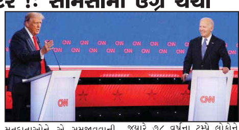
જ્યારે ૭૮ વર્ષના ટ્રમ્પે લોકોને સમજાવ્યું હતું કે લોકો તેને આપ રાષ્ટ્રિક સજ્જથી દુર જુએ અને દેશ માટેની તેની યોજનાઓને જુએ, જેમાં અર્થવ્યવસ્થા સામેલ છે.

એટલાન્ટા (અમેરિકા): અમેરિકામાં આગામી ૫ નવેમ્બરે રાષ્ટ્રપતિ પદની ચૂંટણી થનાર છે ત્યારે રાષ્ટ્રપતિ અને ડેમોક્રેટિક પાર્ટીના ઉમેદવાર જો બાઈડન અને પુર્વ રાષ્ટ્રપતિ અને રિપબ્લીકન પાર્ટીના ઉમેદવાર ટ્રમ્પ વચ્ચે સામસામી પ્રથમ ડિબેટ યોજાઈ હતી જેમાં આ બંને નેતા સામસામા ટકરાયા હતા અને ઉગ્ર ચર્ચા વચ્ચે ગાળાગાળી પણ થઈ હતી. આ ચર્ચા પર પુરી દુનિયાની નજર હતી. જેમાં બાઈડન મતદાતાઓને એ સમજાવવાની કોશિશ કરી રહ્યા હતા કે ૮૧ વર્ષની ઉંમરે તે ફરીથી અમેરિકાના રાષ્ટ્રપતિ બનવા અને દેશને પડકારોથી ઉગારવા સક્ષમ છે.