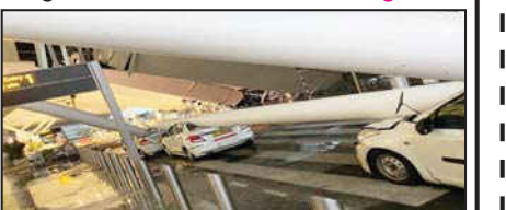
જવામાં આવ્યા હતા. સારવાર દરમિયાન એકનું મોત થયાના સમાચાર છે. માહિતી મળતાની સાથે જ કાયરનો કાફલો ઘટનાસ્થળે પહોંચી ગયો હતો અને મોરચો સંભાળી લીધો હતો. દિલ્હી કાયર સર્વિસના એક અધિકારીએ જણાવ્યું હતું કે, "સવારે લગભગ ૫.૩૦ વાગ્યે, અમને દિલ્હી એરપોર્ટના ટર્મિનલ ૧ પર છત ધરાશાયી થવાની માહિતી મળી. ત્રણ કાયર એન્જિનને ઘટનાસ્થળે મોકલવામાં અનુસંધાન પાના નં. ૪ પર

નવી દિલ્હી : દિલ્હી એરપોર્ટના ટર્મિનલ-૧ પર છત પડી જવાને કારણે મોટી દુર્ઘટના થઈ છે. શુક્રવારે સવારે ટર્મિનલ ૧ પર એરપોર્ટની છત કેટલીક ગાડીઓ પર પડી હતી. આ અકસ્માતમાં ૬ લોકો ઘાયલ થયા છે. ઘટનાની જાણ થતાં જ કાયર બ્રિગેડની ગાડીઓ ઘટનાસ્થળે પહોંચી ગઈ હતી અને બચાવ કામગીરી શરૂ કરી હતી. દિલ્હી કાયર સર્વિસ દ્વારા પ્રાપ્ત માહિતી અનુસાર, દરેકને બચાવીને હોસ્પિટલમાં લઈ