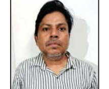
એલસીબીએ અમદાવાદથી તપન સાહુને ઝડપી લીધો : આજે સાંજે રીમાન્ડની માંગ સાથે કોર્ટમાં રજૂ કરાશે : જે કામ છ મહિનાથી અંજાર પોલીસ ન કરી શકી તે છ દિવસમાં એલસીબીએ કરી બતાવ્યું

અંજાર : શહેરમાં સોની વેપારીઓ સાથે કરોડો રૂપિયાની ઠગાઈ કરી ફુલેકું ફેરવીને બંગાળી કારીગર ભાગી ગયો હતો. આર્થિક સંક્રામણમાં આવી જતા વેપારીએ આપઘાત કરી લીધો હતો. જે અંગે ફરિયાદ થતા એલસીબીએ અમદાવાદથી કારીગરને ઝડપી લીધો છે. જે કામ અંજાર પોલીસ ન કરી શકી તે કામ એલસીબીએ કરી બતાવ્યું છે.