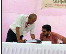
ગુજરાત પ્રદુષણ નિયંત્રણ દ્વારા જે.કે. લક્ષ્મી સિમેન્ટ લિ. મુંઘવાય પેટા બ્લોક - એ માટે લોક સુનાવણી શરૂ : જીપીસીબીના અધિકારી, પ્રાંત અધિકારીના અધ્યક્ષ સ્થાને આયોજન લોક સુનાવણીમાં કંપનીના અધિકારીઓએ સુચિત પ્રોજેક્ટ અંગે આપ્યું પ્રેઝન્ટેશન : સ્થાનિક વિસ્તાર માટે સીએસઆર ફંડમાંથી થનાર વિકાસકામોની રજૂ કરી રૂપરેખા