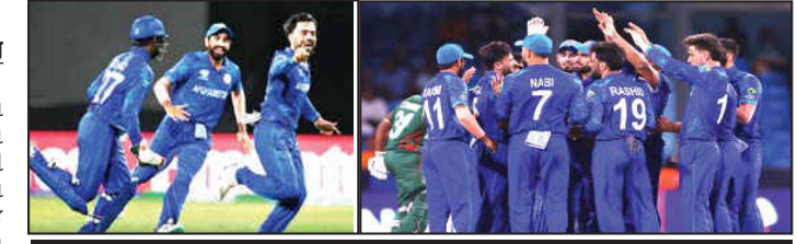
બાંગ્લાદેશ હારતા ઓસ્ટ્રેલિયા ઘરભેગું થયું: અફઘાન ટીમે ૮ રને રોમાંચક મેચ જીતી

બાંગ્લાદેશ હારતા ઓસ્ટ્રેલિયા ઘરભેગું થયું: અફઘાન ટીમે ૮ રને રોમાંચક મેચ જીતી નવી દિલ્હી : આઈસીસી ટી-૨૦ વર્લ્ડ કપ ૨૦૨૪ ના સુપર-૮ તબક્કાની છેલ્લી મેચમાં અફઘાનિસ્તાને બાંગ્લાદેશને ૮ રનથી હરાવ્યું છે. આ સાથે જ અફઘાનિસ્તાને ઈતિહાસ રચી દીધો છે. ટીમે પહેલીવાર કોઈ આઈસીસી ટુર્નામેન્ટમાં સેમિફાઈનલમાં જગ્યા બનાવી છે. બાંગ્લાદેશ હારતા ઓસ્ટ્રેલિયા બહાર ફેંકાયું છે. અફઘાનિસ્તાનેની જીત સાથે જ ઓસ્ટ્રેલિયાની સેમિફાઈનલમાં પહોંચવાની આશા ખતમ થઈ ગઈ છે. સુપર-૮ની ૩ મેચમાં ઓસ્ટ્રેલિયાએ માત્ર એક જ જીત મેળવી છે અને તેના ૨ પોઈન્ટ છે. અફઘાનિસ્તાને ૨ મેચ જીતીને ૪ પોઈન્ટ સાથે સેમિફાઈનલમાં પ્રવેશ કર્યો છે. હવે ૨૭ જૂને ત્રિનિદાદમાં સવારે ૬ વાગ્યે સેમિફાઈનલમાં અફઘાનિસ્તાન સાઉથ આફ્રિકા સામે ટકરાશે. અનુસંધાન પાના નં. ૪ પર