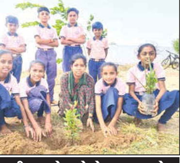
દરેક જણ પોતાના સારા પ્રસંગોમાં વૃક્ષારોપણ કરી અન્યો માટે પ્રેરણારૂપ બને

પુત્ર : વૃક્ષો આપણને અનેક રીતે ઉપયોગી છે. વૃક્ષોના લીલાપાંદડા પ્રકાશ સંશ્લેષણની ક્રિયા દ્વારા હવાને શુદ્ધ કરે છે. વૃક્ષો રક્ષણ આગળ વધતું અટકાવે છે. સાથે વાંદરાને ઠંડા પાડીને વરસાદ લાવવામાં મદદરૂપ થાય છે. વૃક્ષોની શિતલ છાયામાં પશુઓ, ખેડૂતો અને વટેમાર્ગીઓ આરામ કરે છે, તેમજ બાળકો રમે છે. વૃક્ષો ઘરની પર શોભા વધારે છે. વૃક્ષો વિનાની ઘરતી કેશ વિનાના મસ્તક જેવી ઉજળજી લાગે છે. વૃક્ષો કેટલાક વર્ષો પુર્વ આપણા દેશમાં ખુબ હતા તેના જંગલો હોવાથી તેના ઉપર અનેક જંગલી પશુઓ વસવાટ કરતા હતા. જંગલોથી એ પશુઓનું અને એ પશુઓથી જંગલોનું રક્ષણ થતું અને આ જંગલોના કારણે વાતાવરણ ઠંડુ રહેતું અને હવા શુદ્ધ રહેતી, વરસાદ પુષ્કળ આવતો આમ જંગલો આપણા માટે આશીર્વાદરૂપ હતા. સમયાંતરે વસ્તી વધારો થતાં વસાહત, કારખાના, સડકો, રેલમાર્ગ વગેરે