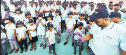
હતા. અભિયાનમાં આશરે એક મેટ્રિક ટન કચરો, ભંગાર, કાચ, ધાતુઓ, પ્લાસ્ટિક કચરો વગેરે એકત્ર કરી તેનો નિકાલ કરવામાં આવ્યું હતું.