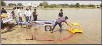
રીમોટથી સંચાલિત રેસ્કયુ કાર્ટ, સ્પીડ બોટ અને ફ્લોટીંગ પંપના માધ્યમથી આપતિના સમયે લોકોનો જીવ બચાવી શકાયો : ભુજના હમીરસર તળાવમાં સાધનોનું ટેસ્ટીંગ કરી ફાયરકર્મીઓને ઉપયોગની તાલીમ અપાઈ

ભુજ : કુદરતી આફતોને આવતી અટકાવી શકાય નહીં પરંતુ આફત ટ્રાટકે ત્યારે બચાવકાર્ય માટે યોગ્ય વ્યવસ્થા અને સશાધનોથી લોકોના જીવ જરૂર બચાવી શકાય છે. ત્યારે કુદરતી આપદાઓથી સતત ઝડપી રહેતા કચ્છ જિલ્લાના ભુજ ફાયર વિભાગને વોટર પ્રિવેન્શન કામગીરી માટે અદ્યતન સાધનોથી સજ્જ કરવામાં આવ્યું છે. ગુજરાત સ્ટેટ ફાયર પ્રિવેન્શન ગાંધીનગર દ્વારા ભુજ ફાયર સ્ટેશનને વોટર રેસ્કયુ માટે અદ્યતન સાધનોની ફાળવણી કરવામાં આવી છે. જેમાં રેસ્કયુ કાર્ટ, સ્પીડ બોટ, ફ્લોટીંગ પંપના સમાવેશ થાય છે. આજે ભુજ શહેરના હમીરસર તળાવમાં ફાળવાયેલા અદ્યતન સાધનોનું ટેસ્ટીંગ કરાયું હતું અને ફાયર કર્મીઓને સાધનોનો કેવી રીતે ઉપયોગ કરી શકાય તેની તાલીમ અપાઈ હતી. ફાયર વિભાગના અધિકારીઓએ જણાવ્યું હતું કે