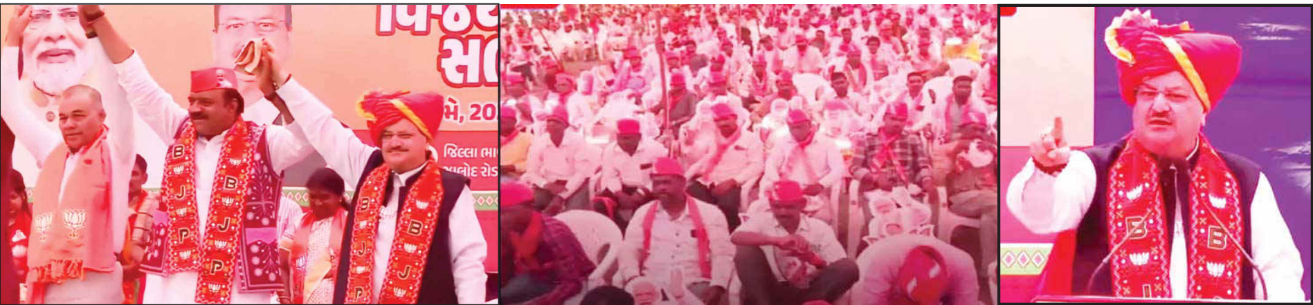
ગાંધીનગર : ભારતીય જનતા પાર્ટીના રાષ્ટ્રીય અધ્યક્ષ જે પી નડા ગુજરાતના બે દીવસ પ્રવાસે પર છે. તેઓએ આજ રોજ રાજ્યના આદિવાસી વિસ્તાર દાહોદમાં વિશાળ

દાહોદમાં ભારતીય જનતા પાર્ટીના અધ્યક્ષે વિશાળ જનસભાને કર્યું સંબોધન : ભાજપસરકારની વર્ષાવી વિકાસગાથા, વિપક્ષ પર વરસાવ્યા શાબ્દીક ચાબખા